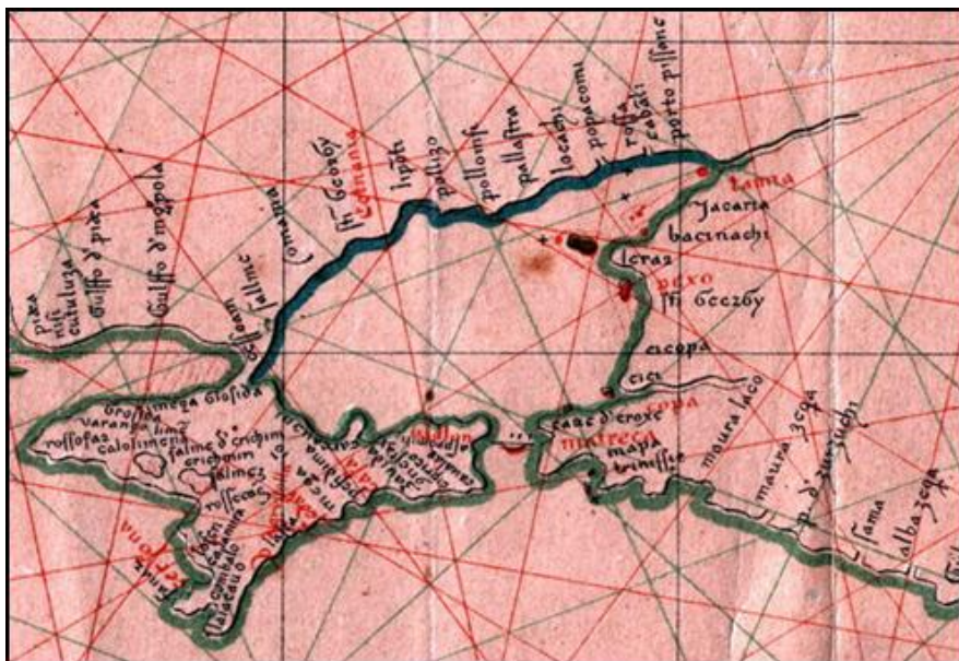
Фото. Азовское море Meotides Paludes, Знаменитая Торговая Земля Приазовья - «Dove e terra di trafico», торговый город-порт Полоники - Polonixi на месте нынешнего Бердянска у основания Бердянской Косы на фрагменте средневекового портолана начала XIV века (1317 года). Ну а название Полоники – Polonixi торговый город у основания Бердянской Косы («Agara promontoriu») мог получить и потому, что был строго по курсу Полярной звезды («Polo»), если плыть к нему от Боспора Киммерийского (Керченского пролива).

Во время походов против Золотой Орды в 1389-1395 годах грозный самаркандский правитель Тимур Тамерлан (1336-1405) стер с лица земли торговые города Прикаспия, Восточного Крыма, Северного Приазовья, разгромил войско золотоордынского царя Тохтамыша на реке Терек и гнал до окрестностей Москвы, где и добил его окончательно. Жестоко разрушил грозный Тамерлан в 1396 году и блистательную столицу Золотой Орды Сарай Берке - крупнейший и красивейший город Востока в низовье Волги. Именно поэтому вскоре и прекратила свое существование могущественная Золотая Орда.